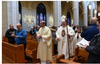
Celebrando a Nuestra Virgen de Guadalupe 10 de diciembre Basílica St. Peter and Paul - Lewiston